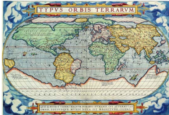
Carte du monde datant de 1583

Il s'agira d'étudier les différentes façons que nous avons pour appréhender le monde dans lequel nous vivons . Nous soulignerons l'importance des découvertes scientifiques sur nos représentations du monde et insisterons sur le bouleversement provoqué par la découverte de nouveaux continents et d'autres peuples , ce qui nous amènera à nous demander si on peut dire que la culture européenne est supérieure aux autres cultures et si on peut surmonter notre tendance à rejeter ce qui est différent de nous. Ensuite, nous nous demanderons comment et pourquoi les hommes ont proposé leur représentation du monde et s'il existe des différences culturelles entre ces représentations . Enfin, nous nous questionnerons sur la place de l'homme dans ce monde , notamment dans ses rappports avec les animaux , car l'homme est un animal mais il a tendance à se penser supérieur aux autres animaux. Nous verrons les fondements et ferons une critique de cette tendance.