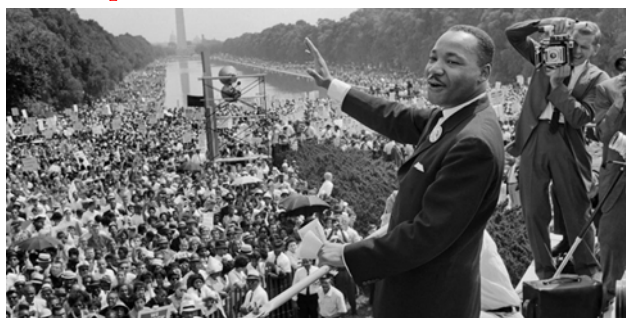
Discours de Martin Luther King devant une immense foule en 1963

Il s'agira d'étudier la question du langage , notamment dans sa dimension orale (parlée), et d'analyser ses fonctions ( décrire le monde, transmettre un message, donner un ordre, séduire... ). Nous rechercherons aussi les points communs et les différences entre différentes langues pour mieux en comprendre le fonctionnement. Nous aborderons alors la question centrale des pouvoirs de la parole , qui ne se réduit pas à la transmission d'un message, puisque la parole suppose le partage d'un code culturel commun et implique un effet direct sur celui ou ceux à qui on s'adresse . Nous étudierons l'immense efficacité de la