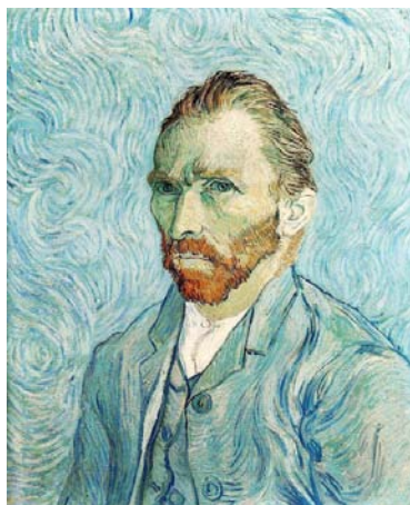
Autoportrait de Van Gogh, 1889

Nous aborderons la question de l'identité personnelle : dire « je » à propos de soi-même nous semble évident mais la recherche des fondements de ce « je » est complexe. Nous