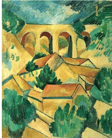
Braque, Le viaduc à l'Estaque, 1908

Nous découvrirons de nouveaux domaines de réflexion. Tout d'abord le domaine de l'art et de la création . Nous étudierons la présence de pratiques artistiques dans toutes les cultures et à toutes les époques . Nous tenterons de comprendre comment on crée une œuvre, et comment l'art évolue au cours du temps (toujours à la fois en s'inspirant et en rompant avec les formes d'art qui précèdent).